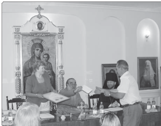
Вручение грамот журналистам, участвовавшим в конкурсе. МКУ, 13 июля 2007 года