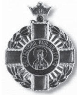
Орден святой равноап. вел. кн. Ольги III степени