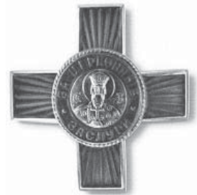
Орден святого равноап. вел. кн. Владимира, III степени