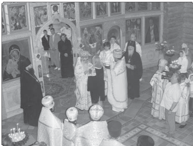
Владыка Экзарх награждает попечителей Всехсвятского прихода г. Минска.