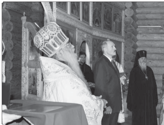
Перед награждением Президента РБ А.Г. Лукашенко орденом свт. Кирилла, епископа Туровского.